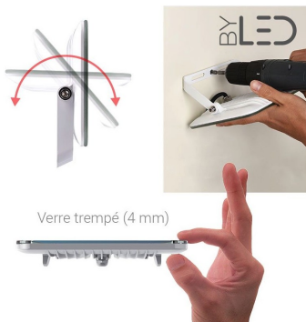
Verre trempé (4 mm)