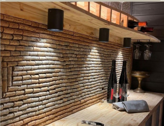
Eclairage d'une cave à vin avec les produits BYLED - Spot downlight en applique étanche 7W - STACK

NOS CLIENTS FONT CONFIANCE AUX PRODUITS BYLED