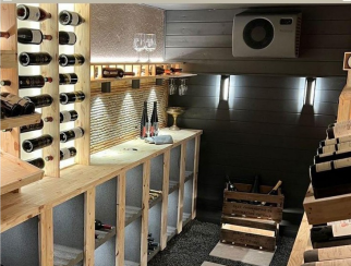
Eclairage d'une cave à vin avec les produits BYLED - Spot downlight en applique étanche 7W - STACK - Applique LED murale d'extérieur 6W - SHELF

NOS CLIENTS FONT CONFIANCE AUX PRODUITS BYLED