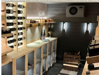
Eclairage d'une cave à vin avec les produits BYLED - Spot downlight en applique étanche 7W - STACK - Applique LED murale d'extérieur 6W - SHELF

NOS CLIENTS FONT CONFIANCE AUX PRODUITS BYLED