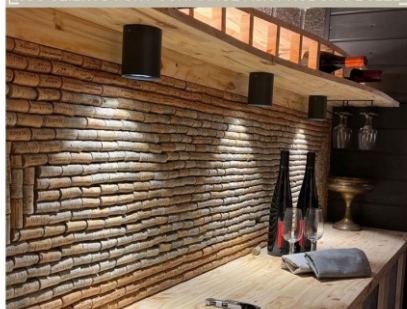
Eclairage d'une cave à vin avec les produits BYLED - Spot downlight en applique étanche 7W - STACK

NOS CLIENTS FONT CONFIANCE AUX PRODUITS BYLED