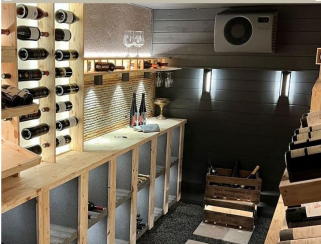
Eclairage d'une cave à vin avec les produits BYLED - Spot downlight en applique étanche 7W - STACK - Applique LED murale d'extérieur 6W - SHELF

NOS CLIENTS FONT CONFIANCE AUX PRODUITS BYLED