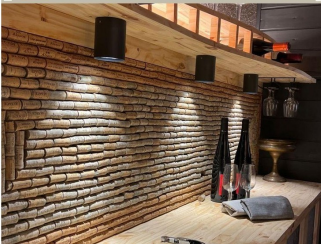
Eclairage d'une cave à vin avec les produits BYLED - Spot downlight en applique étanche 7W - STACK

NOS CLIENTS FONT CONFIANCE AUX PRODUITS BYLED