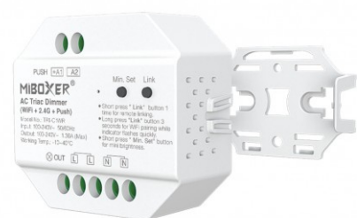
Interrupteur filaire + sans fil

Ce télévariateur s'installera entre votre arrivée 230V et votre luminaire, enfin de pouvoir le piloter à distance, sans fil, grâce à une télécommande MiBoxer, il est également possible de placer le télévariateur 230V derrière un interrupteur à bouton poussoir installé dans une boîte d'encastrement d'au moins 50 mm de profondeur.