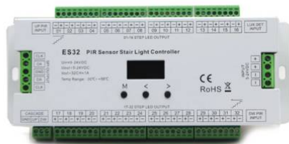
Capteur lumière ambiante (30cm) (1 pièce)