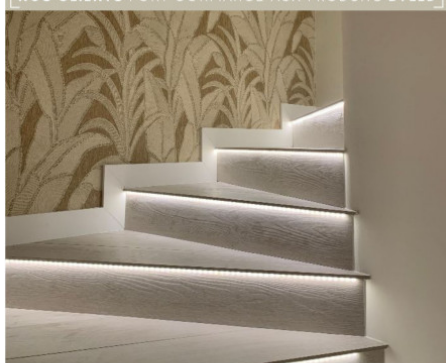
Mise en lumière d'un escalier avec les produits BYLED - Ruban LED - 4,6W/m - 6000K - 60LED/m - 2835- haute fidélité

NOS CLIENTS FONT CONFIANCE AUX PRODUITS BYLED