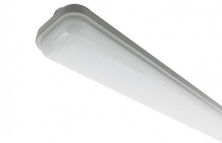
PATTE DE FIXATION POUR SUSPENSION X2

Branchement facilité grâce aux 2 connecteurs sans vis situés à chaque extrémité de la réglette permettant un montage simple et rapide en cascade.